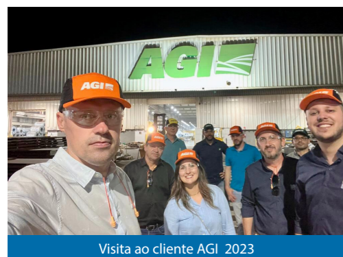
Visita ao cliente AGI 2023