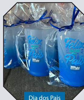
Dia dos Pais