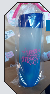
Dia das mães