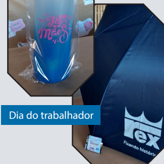
Dia do trabalhador

A AdriRex reforça ser um espaço de lazer e descontração comum para todos os associados. Deste modo, conta com a compreensão de todos para o cumprimento das regras. Não é permitido que menores de idade utilizem o espaço sem a presença dos pais ou responsáveis. Em caso de descumprimento, o associado será penalizado.