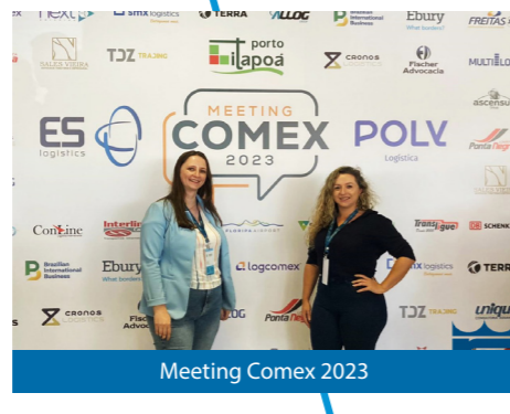
Meeting Comex 2023