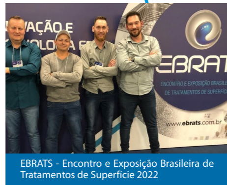
EBRATS - Encontro e Exposição Brasileira de Tratamentos de Superfície 2022